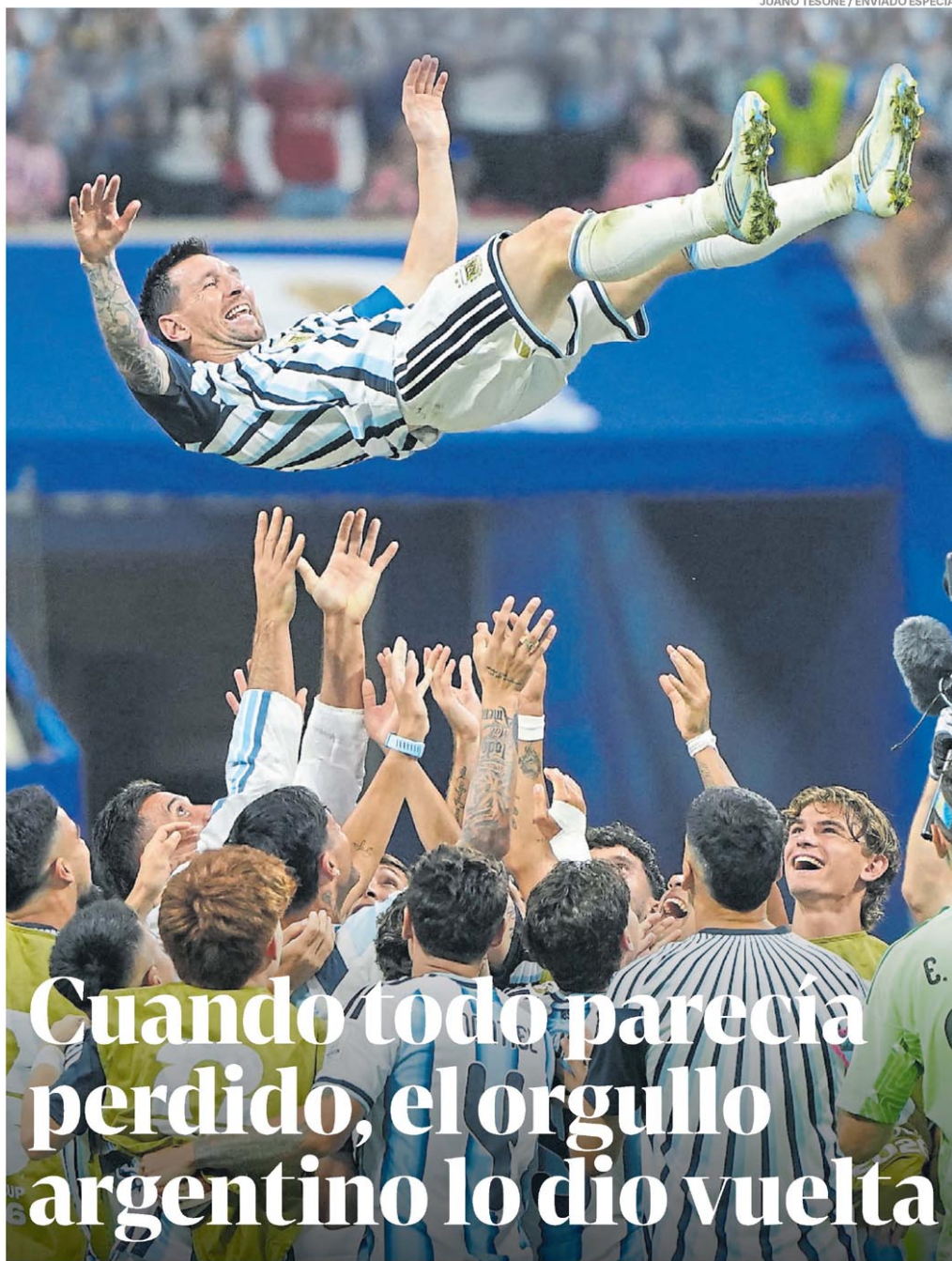
JUANO TESONE / ENVIADO ESPECIAL

BUENOS AIRES, ARGENTINA, AÑO LXXX N° 28.957, PRECIO: $4.300,00 EN CABA Y GBA - RECARGO ENVÍO AL INTERIOR $ 800,00 - PRECIO DE LOS OPCIONALES, EN EL ÍNDICE DE LA PÁGINA 50.