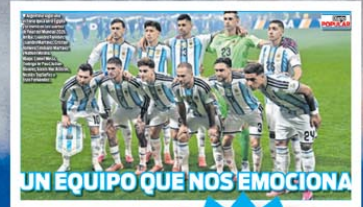
UN EQUIPO QUE NOS EMOCIONA

HOY, LAMINA LA SELECCION PUSO LO QUE HAY QUE PONER