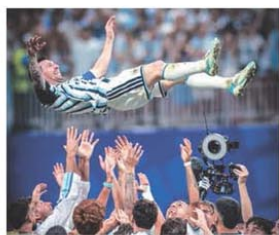
Lionel Messi contra Egipto que le permitió a la Selección entrar a los cuartos de final de la Copa del Mundo. PÁG. 15

El presidente Javier Milei, el ex mandatario Mauricio Macri, gobernadores, legisladores y funcionarios del oficialismo y de la oposición destacaron la remondata del equipo que capitanea