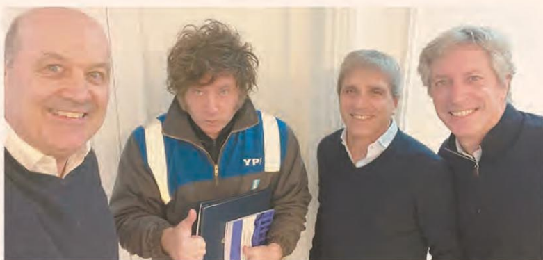
MILEI DEFINE LOS CAMBIOS DE LA CARTA ORGÁNICA DEL CENTRAL

Merval 3.223.997 ▼ -1,33% — S&P 500 7.537 ▲ 0,72% — Dólar BNA 1.515 ▲ 0,33% — Euro 1,140 ▼ -0,03% — Real 5,166 ▲ 0,17% — Bitcoin 63.522 ▼ -0,23%