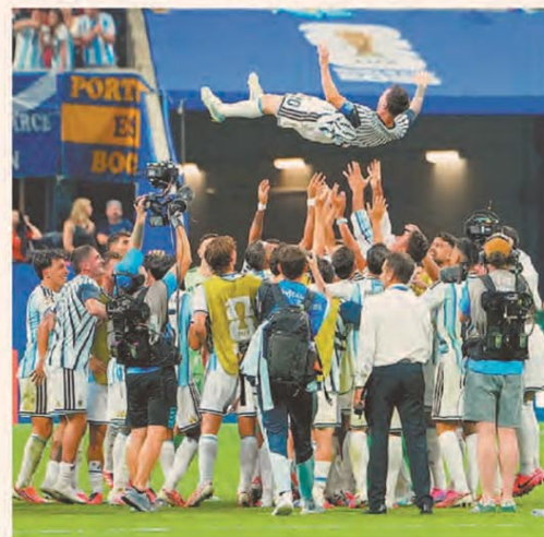
EL MINISTRO RECIBIÓ A LOS SUPERMERCADISTAS

quilidad a los inversores. Después del anuncio del programa financiero 2027, el próximo hito que podría ayudar a un nuevo descenso del indicador (que terminó en 405 puntos) es el pago en el día de mañana de los u$s 4300 millones a bonistas y la reinversión de esos fondos en títulos argentinos. Para que esta tendencia sea sostenible, no solo la actividad económica tiene que mejorar, sino que la tasa de interés de EE.UU. debe mantenerse estable. — P. 14