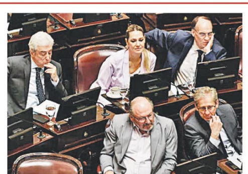
Carolina Losada, una de las críticas del proyecto

Por Lic. Guillermo Moreno, Lic. Pablo Challú Lic. Walter Romero