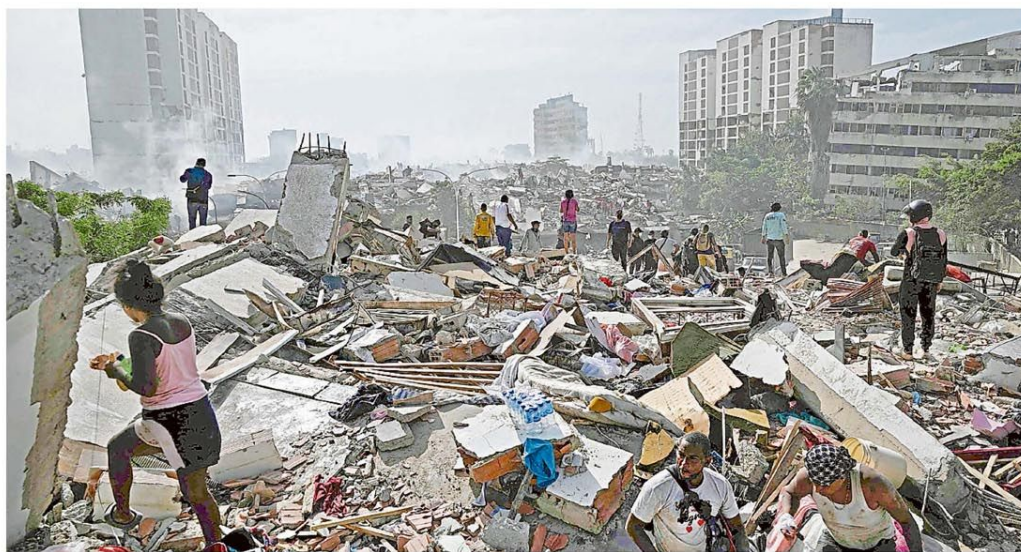
Residentes de Caraballeda, estado de La Guaira, rastrean pertenencias entre los escombros

VIERNES 26 DE JUNIO DE 2026 | LANACION.COM.AR