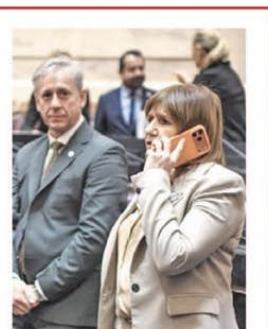
Bullrich lideró la estrategia

El oficialismo consiguió otro blindaje para Adorni