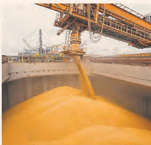
Se acerca el fin de la cosecha gruesa, y el mercado espera que se modere la oferta de divisas

Con la expectativa de que junio sea el mes en el que la inflación porfore el 2%, la mirada de los analistas se empezó a extender al segundo semestre. En ese escenario, cobra relevancia la moderación de un factor que había impactado en el IPC durante los primeros meses de 2026: el proceso de corrección de las tarifas de servicios públicos ya está bastante avanzado. Los expertos aseguran que los valores actuales cubren alrededor de 70% del costo, con lo cual restan ajustes moderados. Lo que queda por resolver es la ecuación del costo del transporte, pero con la baja del petróleo y de los combustibles derivados, el impacto de la categoría servicios en la segunda mitad del año luce más leve. Queda el dólar, desde ya, pero las consultoras no esperan que las correcciones actuales se vuelvan un salto brusco. — P. 4, 5 y 14