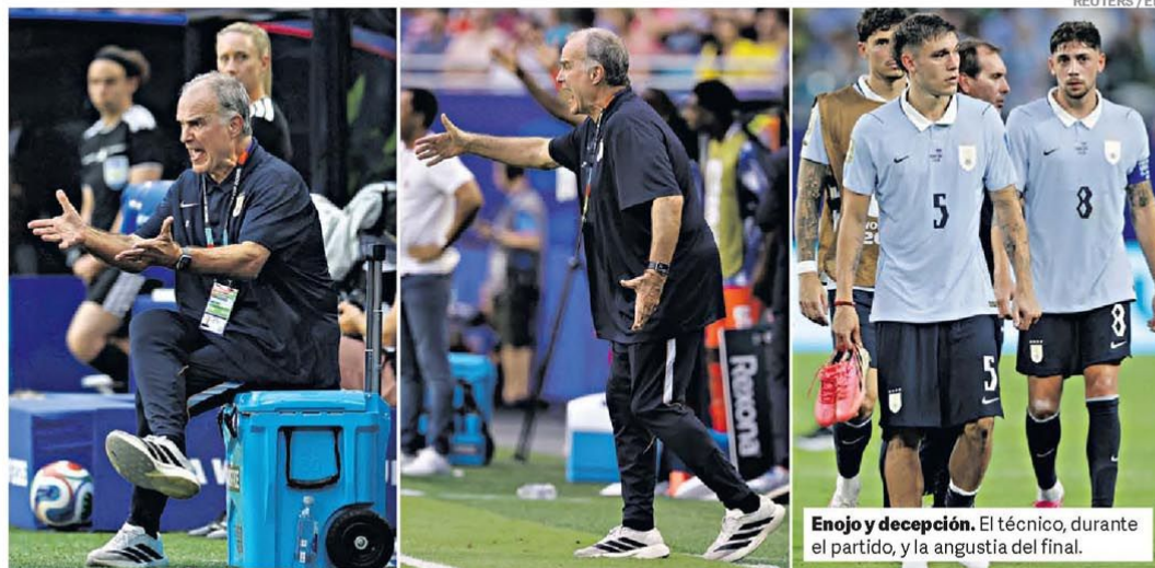
Enojo y decepción. El técnico, durante el partido, y la angustia del final.

Es la causa por presunto enriquecimiento ilícito del ex funcionario de Kicillof, cercano a Máximo Kirchner. Se demora la pericia patrimonial. P.13