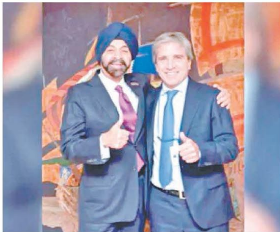
El respaldo del Banco Mundial que preside Ajay Banga le permite a Caputo reducir el costo del financiamiento externo

La utilización de la capacidad instalada de la industria alcanzó el 59,9% en abril. Sigue pesando la débil demanda interna