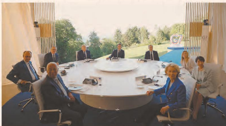
Los jefes de Estado que integran el G7, junto a la titular de la UE, se reúnen desde ayer en el sur de Francia

El presidente Donald Trump confirmó ayer, en el inicio de la cumbre del G7 en Francia, que el preacuerdo de paz alcanzado con Irán ya fue firmado en forma digital y será ratificado este viernes durante un encuentro en Suiza. La novedad generó un clima de euforia en los mercados, ya que si bien quedan otros 60 días de negociaciones para resolver los temas más urticantes del conflicto, los analistas creen que esta vez los consensos conseguidos son más firmes. La reapertura del Estrecho de Ormuz desactiva la crisis de abastecimiento energético que alarmaba tanto a países de Europa como a China. Y el descenso del precio del petróleo a una zona de 80 dólares el barril, también reduce significativamente el horizonte de la inflación en Estados Unidos y los movimientos de la tasa que debería hacer la Fed. La movida benefició a la Argentina, cuya tasa de riesgo país ya está en niveles de 2018. — P. 14, 15 y 22