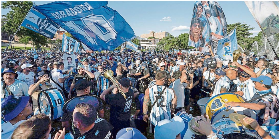
Banderazo de hinchas de la selección argentina, ayer, en Kansas City