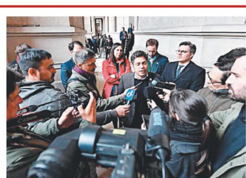
El gobernador al salir de la audiencia en la Corte Suprema

El viceministro de Economía dijo que "el superávit fiscal aún depende de Milei y de Caputo"