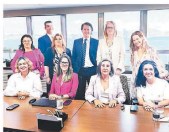
Representantes de DaVita, Grupo Olmos, NEFRA LATAM y el estudio Demarest durante la firma del acuerdo que formaliza el desembarco de NEFRA Medical Care en Brasil