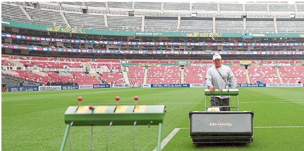
Los ajustes finales en el estadio Azteca, que, como en 1970 y 1986, será sede de una Copa del Mundo