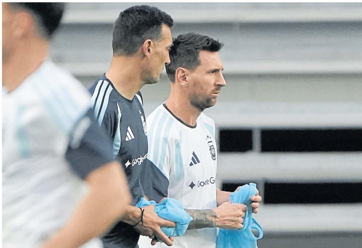
Esta noche sí. Messi dejó con las ganas a todos el jueves ante Honduras, pero hoy jugará contra Islandia. Scaloni no confirmó si va de arranque.

A una semana del debut mundialista y de su sexta Copa del Mundo, hoy juega el rosarino