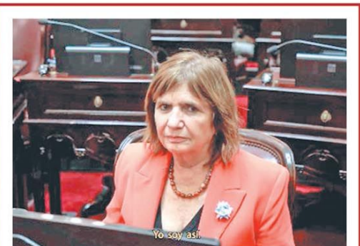
Provocó con un video usando la milonga Se dice de mí

La inflación desaceleró en CABA, marcó 2,1% y hubo mayor suba de alimentos PÁG. 3