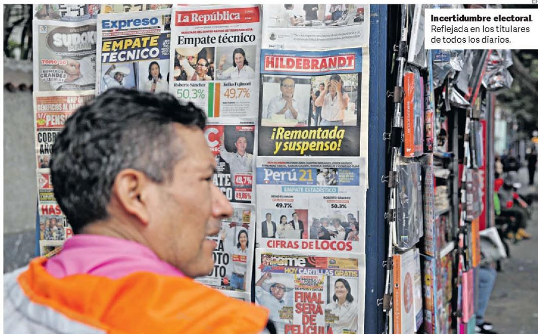
Incertidumbre electoral. Reflejada en los titulares de todos los diarios.

El Gobierno enviará al Congreso un nuevo proyecto de Inocencia Fiscal. Entre los principales cambios figuran la eliminación de topes para quienes no sean grandes contribuyentes y el plazo para efectuar el blanqueo: se podrá hacerlo sólo hasta el 31 de diciembre de 2027. Hasta esa fecha se podrá ingresar dinero no declarado sin tener que pagar de forma retroactiva por esos fondos. P.5