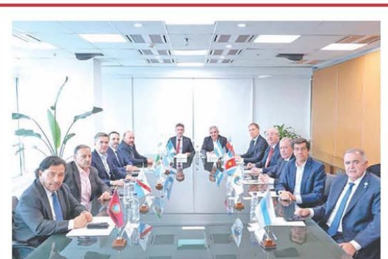
Los mandatarios junto al ministro del Interior

La Justicia de EE.UU. rechazó el pedido de Burford para revisar el fallo YPF PÁG. 4