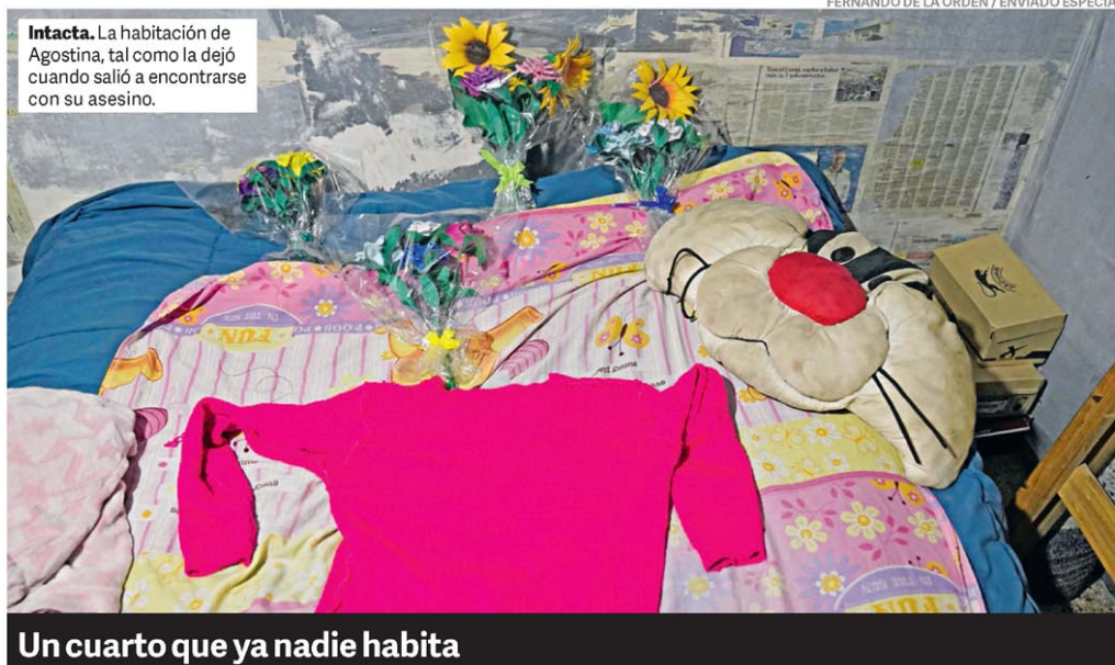
Intacta. La habitación de Agostina, tal como la dejó cuando salió a encontrarse con su asesino.

La polémica se desató después de que se descubriera que Yamandú Orsi recibió un descuento de US$ 25.000 por el vehículo. Y creció al conocerse que entregó como parte de pago una camioneta que había sido donada para su campaña. Ahora, Orsi dijo que entregará la camioneta que compró a la Administración Nacional de Educación Pública para el traslado de niños. P.25