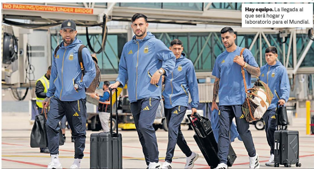
Hay equipo. La llegada al que será hogar y laboratorio para el Mundial.

El ejército israelí tomó un estratégico castillo medieval ubicado en la cima de un cerro en el sur del país, el mayor avance en territorio libanés en 26 años. En paralelo, el presidente de EE.UU. reenvió a los iraníes una propuesta de acuerdo de paz con condiciones más duras que las contenidas en los borradores anteriores. Irán pidió que se respeten sus "derechos". P.28