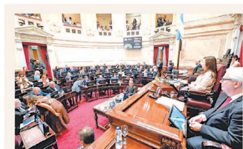
Está previsto que la Cámara alta sesione el jueves

La coparticipación sube por Ganancias, pero aún está en rojo en la medición interanual