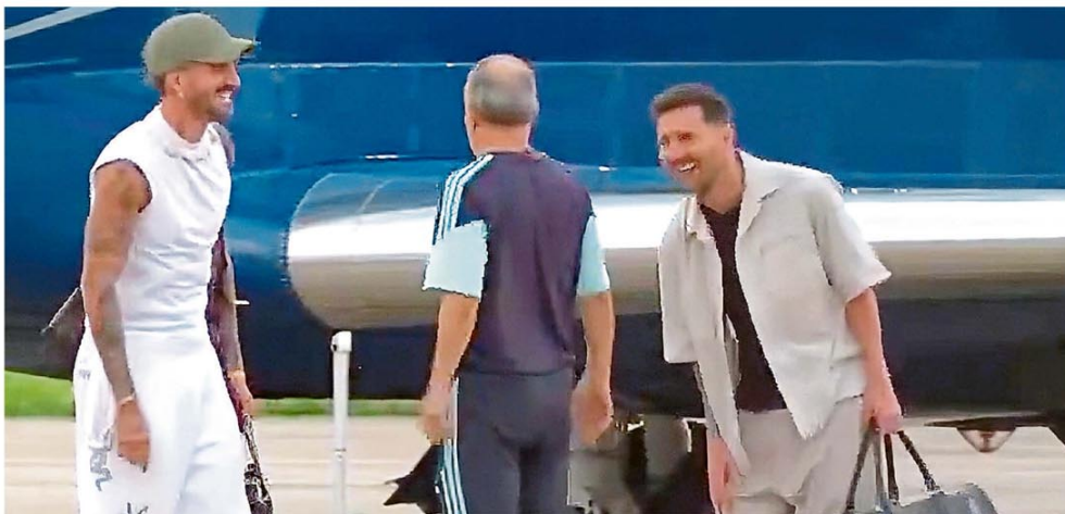
CAPTURA DE VIDEO

Deportes. — Se acerca el Mundial y la Argentina acelera la cuenta regresiva: el campeón se instaló ayer en Kansas rumbo al debut, el 16 frente a Argelia. Lionel Messi se incorporó anoche con Rodrigo De Paul y, junto con algunos compañeros que arribaron desde otros puntos, se sumaron a los 18 futbolistas que viajaron desde Buenos Aires. Hoy, con el inicio de las prácticas, habrá más certezas sobre el capitán, que se recupera de una pequeña lesión muscular.