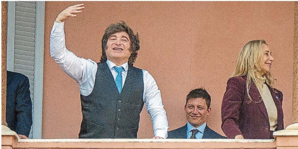
Milei se mostró en el balcón de la Casa Rosada con Santiago Caputo y su hermana, referentes de la cruda interna libertaria

TEDEUM. "Nos falta una clase dirigente que se anime a la reconciliación", afirmó el arzobispo García Cuerva, que habló de un "desmembramiento social"; el Gobierno eludió confrontar