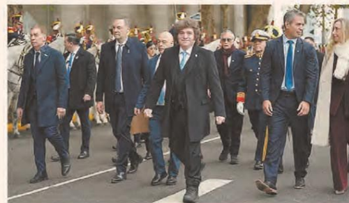
TEDEUM EN LA CATEDRAL POR EL 25 DE MAYO