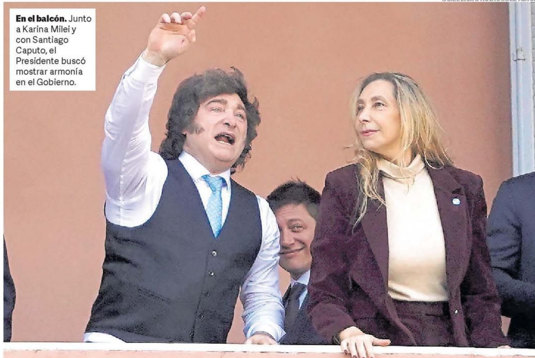
En el balcón. Junto a Karina Milei y con Santiago Caputo, el Presidente buscó mostrar armonía en el Gobierno.