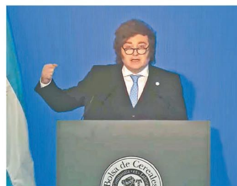
En tono de campaña, fue a la Bolsa de Cereales