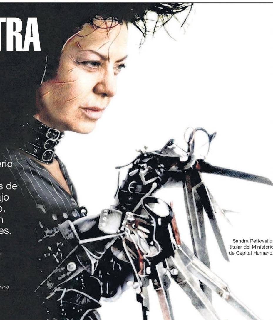
Sandra Pettovello, titular del Ministerio de Capital Humano.