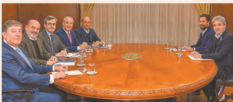
REAPARECE EN LA AGENDA LA BÚSQUDA DE UN NUEVO PACTO FISCAL

Merval 2.774.731 ▼ -1,47% — S&P 500 7.403 ▼ -0,07% — Dólar BNA 1.420 ► 0,00% — Euro 1,160 ▲ +0,01% — Real 5,043 ▼ -0,06% — Bitcoin 76.971 ▼ -0,01%