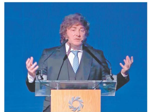
El Presidente estuvo en un evento bancario

La UIA le pide a Caputo suspender embargos y reducir contribuciones patronales PÁG. 4