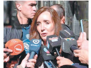
VILLARRUEL, SOBRE ADORNI

LA INFLACIÓN MAYORISTA FUE DE 5,2% EN ABRIL