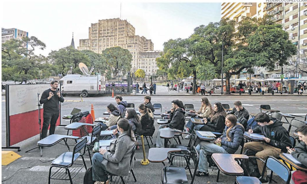
Clases en la calle como protesta. Fue en distintas sedes de la UBA, con profesores, decanos y autoridades universitarias.