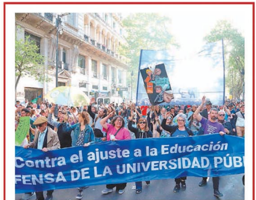
Mañana se realizará la cuarta edición de la protesta

Vence el buffer de 45 días: YPF decidirá sobre los precios de los combustibles PÁG. 3