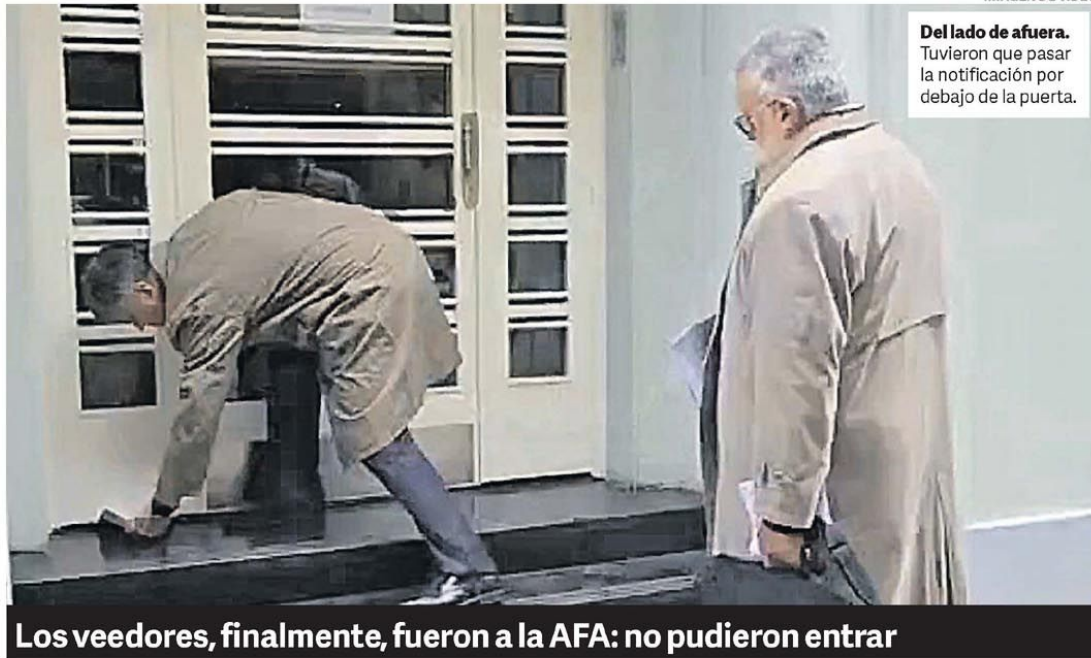
IMAGEN DE VIDEO

“No doy explicaciones para no obstruir la Justicia”, dijo el jefe de Gabinete.