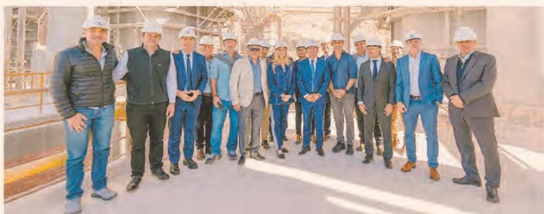
Karina Milei ayer en Expo Minera en San Juan con Diego Santilli, Martín Menem y nueve gobernadores

Merval 2.834.283 ▼ -1,63% — S&P 500 7.365 ▲ +1,46% — Dólar BNA 1.420 ▲ +0,71% — Euro 1,172 ▲ +0,07% — Real 4,926 ▲ +0,07% — Bitcoin 79.850 ▼ -0,07%