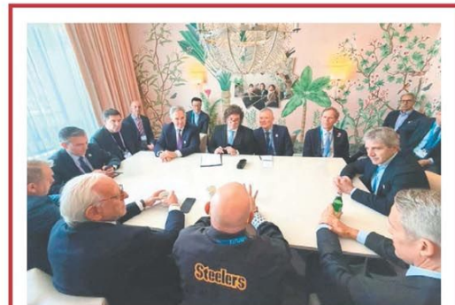
Milei se reunió con empresarios en EE.UU.