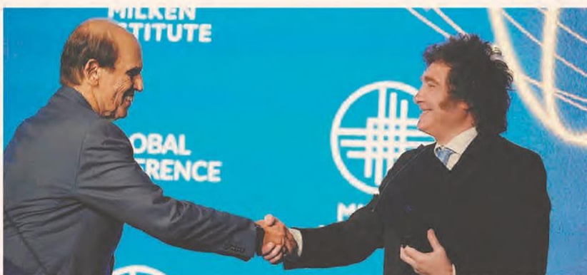
Milei saluda a Michael Milken, anfitrión de la conferencia sobre inversiones desarrollada en Los Ángeles

Merval 2.881.352 ▲ +4,43% — S&P 500 7.259 ▲ +0,81% — Dólar BNA 1.410 ▼ -0,35% — Euro 1,174 ▲ +0,03% — Real 4,921 ▼ -0,02% — Bitcoin 81.408 ▼ -0,01%