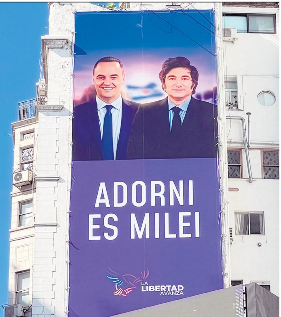
Foto de la campaña de Manuel Adorni para las elecciones 2025 en CABA.