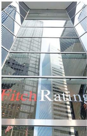
Fitch, calificador global

La nota pasó de CCC+ a B- por el ajuste fiscal, la compra de dólares y la agenda de reformas