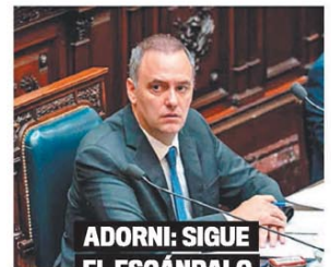
ADORNI: SIGUE EL ESCÁNDALO