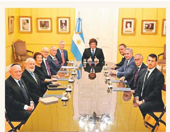
Continúa el apoyo hacia el jefe de Gabinete

Mediciones privadas confirman que, luego de diez meses, el IPC desaceleró en abril PÁG. 3