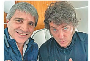
EN BUSCA DE INVERSIONES

ENCONTRARON AL NIÑO DE SEIS AÑOS QUE HABÍA DESAPARECIDO EN CORRIENTES Y DETUVIERON A SU PADRE