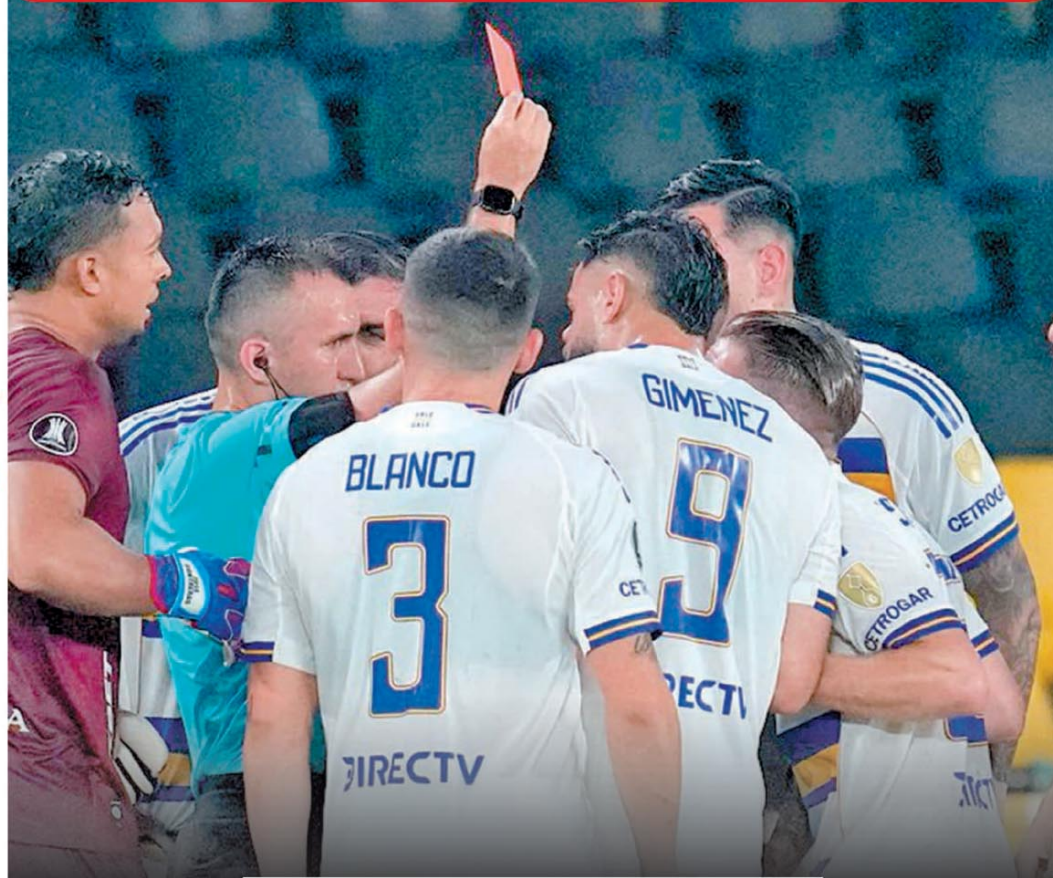
BOCA, COMPLICADO EN LA LIBERTADORES