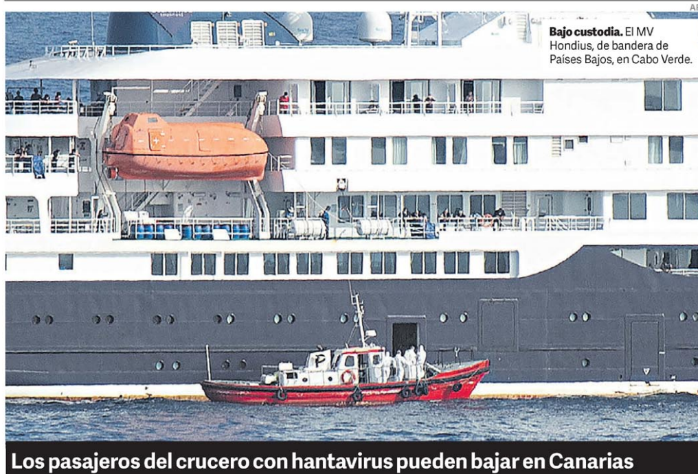
Bajo custodia. El MV Hondius, de bandera de Países Bajos, en Cabo Verde.

La Justicia brasileña rechazó dos recursos que presentó la defensa del actor. Así quedó confirmada la condena a seis años en la causa por abuso sexual contra la actriz Thelma Fardin. Darthés, que se radicó en ese país a fines de 2018, tiene que cumplir la pena bajo un régimen semiabierto. Puede salir durante el día, pero debe dormir en la cárcel. P.37