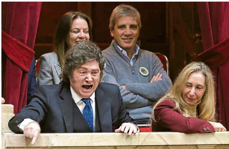
Milei increpa a la diputada Bregman, desde un palco junto a su hermana, Caputo y Pettovello.

La esencia del liberalismo es la sacralización de la autonomía personal. Ese respeto no es irrestricto porque los individuos deben ceder parte de su libertad con el propósito de construir una organización que gestione la vida en común. Esa organización se llama Estado. Para evitar que esa entidad se vuelva avasallante contra quienes le otorgan esa capacidad, se establecen dos instituciones que, para cumplir su misión, deben ser independientes: la Justicia y la prensa. Continúa en la página 12