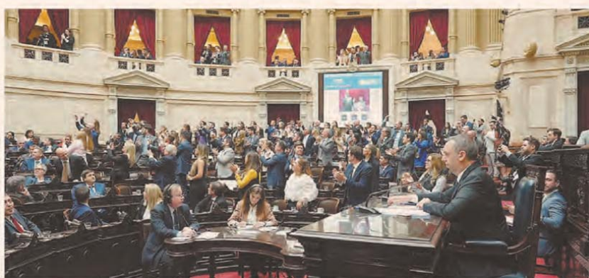
EL PRESIDENTE Y LOS MINISTROS APOYARON AL JEFE DE GABINETE DESDE LOS PALCOS