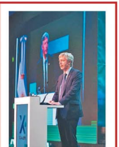
Disertó en Expo EFI

Con gritos y despliegue, Milei buscó pasar a la ofensiva PÁG. 12