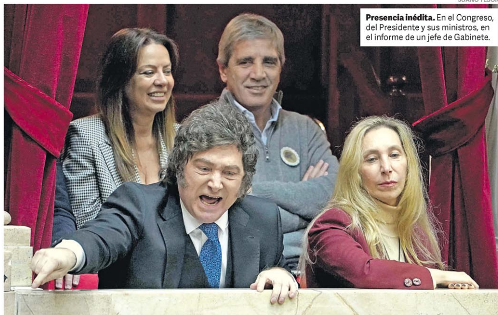
Presencia inédita. En el Congreso, del Presidente y sus ministros, en el informe de un jefe de Gabinete.