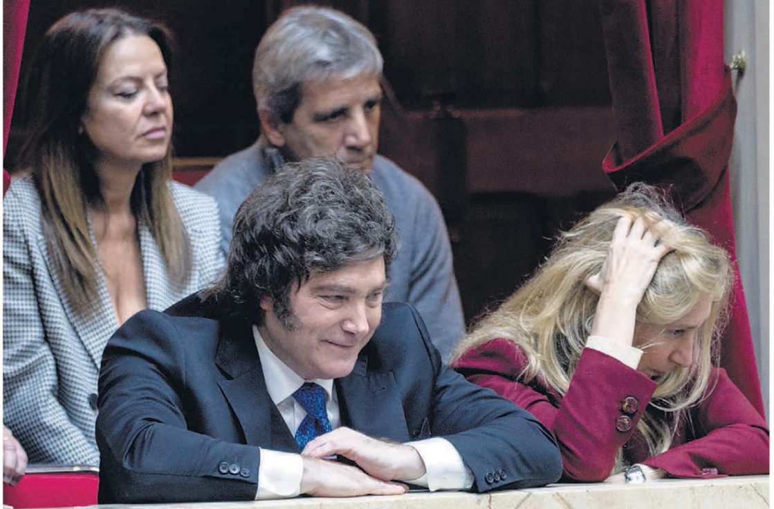
Javier y Karina Milei, Luis Caputo y Sandra Pettovello apoyando a Manuel Adorni desde el balcón del Congreso.