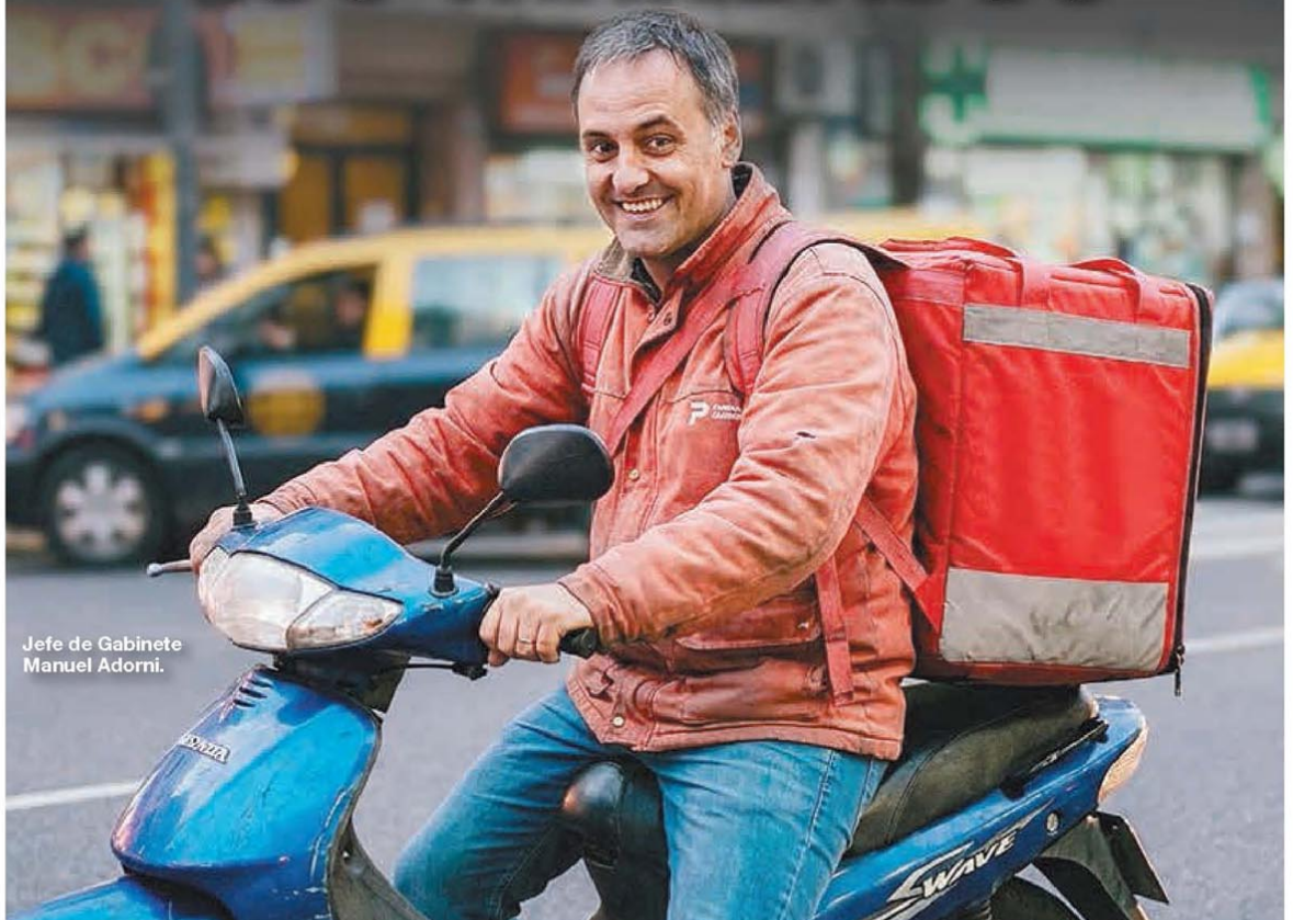
Jefe de Gabinete Manuel Adorni.