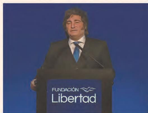
ASEGURÓ QUE "LA INFLACIÓN VA A CEDER"

La presión fiscal le juega en contra a la recuperación: los impuestos se llevan hasta 60% de los intereses — P.9