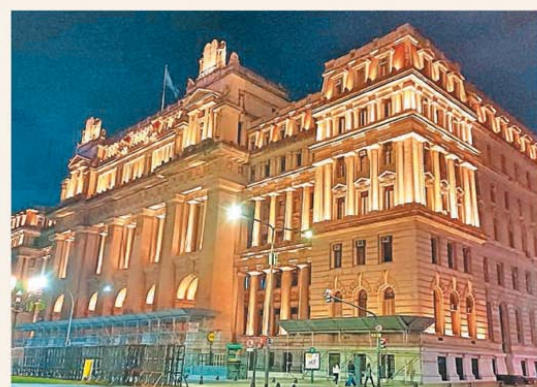
La Cámara del Trabajo revirtió el sentido de la cautelar

La Justicia revocó la cautelar y la reforma laboral está vigente