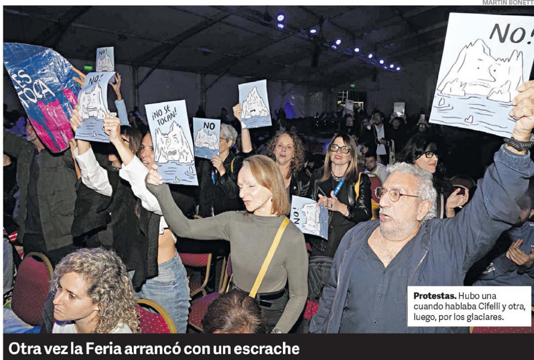
Protestas. Hubo una cuando hablaba Cifelli y otra, luego, por los glaciares.

Los encontró la jueza Capuchetti en una causa en que se investiga a la financiera de Ariel Vallejo, ligada a Chiqui Tapia, por maniobras con el dólar durante el cepo K. Entre las 200 cajas de seguridad en el local de Lomas de Zamora había una a nombre de una costurera, con lingotes de oro. Suponen que se trata de una prestanombre y que lo mismo ocurriría con el resto. P.10