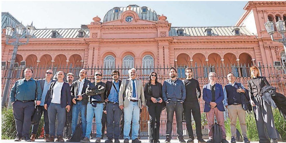
Periodistas acreditados posan en Plaza de Mayo luego de que no los dejaran entrar a la Casa de Gobierno