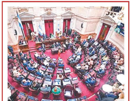
El Ejecutivo giró el proyecto y lo debatirá el Senado

Se espera algo de alivio: para marzo se proyecta un rebote del PBI PÁG. 2