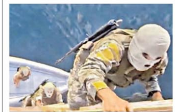
Enmascarados. Así abordaron un buque.

El mileísmo envió el proyecto de reforma electoral al Senado. Uno de los puntos principales es el que plantea el incremento del 2% al 35% del tope máximo que un individuo o una empresa puede aportar a una fuerza para una campaña electoral. Se suma a las propuestas para eliminar las PASO y para incluir Ficha Limpia para personas condenadas. P.10