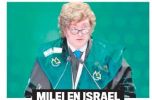
MILEI EN ISRAEL