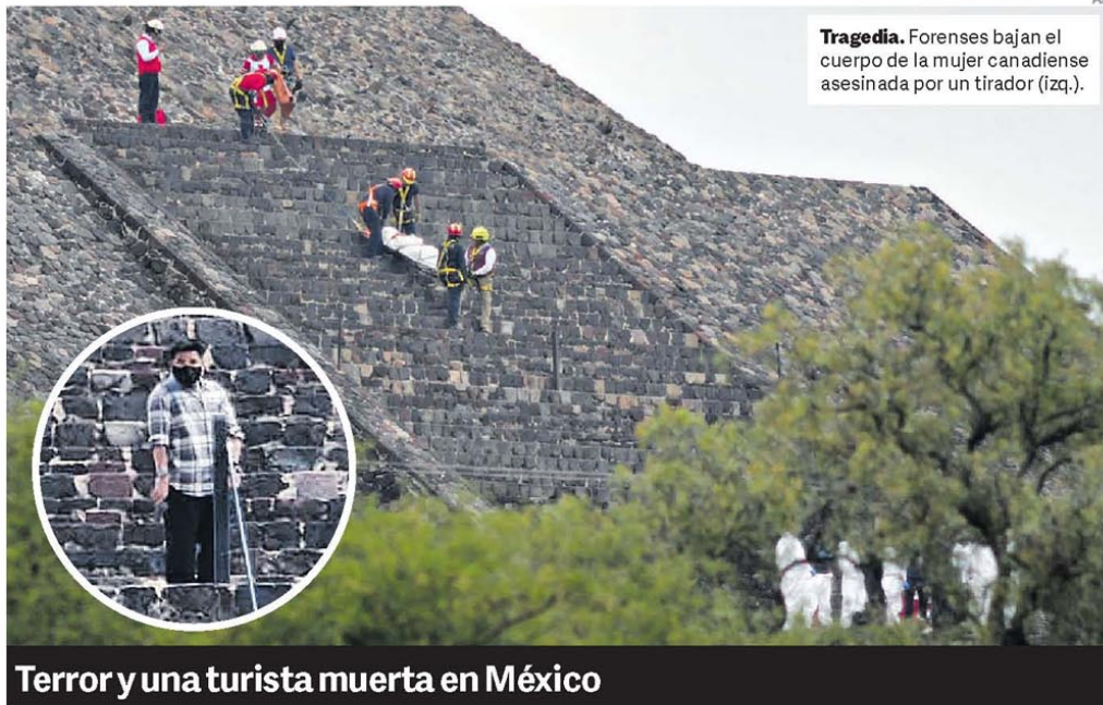
Tragedia. Forenses bajan el cuerpo de la mujer canadiense asesinada por un tirador (izq.).

Con más de 60 años de trayectoria en teatro, cine, y televisión, Luis Brandoni era el último de una dinastía de grandes actores que marcaron a fuego el espectáculo argentino. Su pasión y su compromiso se plasmaron también en la política, donde llegó a ser diputado nacional por la UCR, y en la actividad gremial. Activo hasta el final, murió a los 86, como consecuencia de un accidente doméstico. P.3