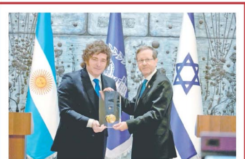
El jefe de Estado fue recibido por Isaac Herzog en Tel Aviv

Adorni: la inmobiliaria confirmó que el departamento se vendió por debajo de su valor PÁG. 13