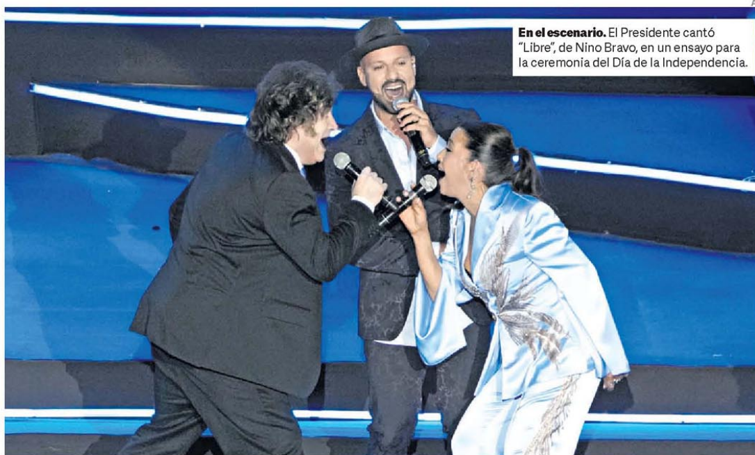
En el escenario. El Presidente cantó "Libre", de Nino Bravo, en un ensayo para la ceremonia del Día de la Independencia.

Mansión de Pilar Había más de una docena de autos de empresas del tesorero de AFA.