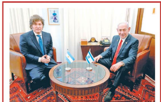
En pleno conflicto, Milei viajó a Israel y profundizó el vínculo