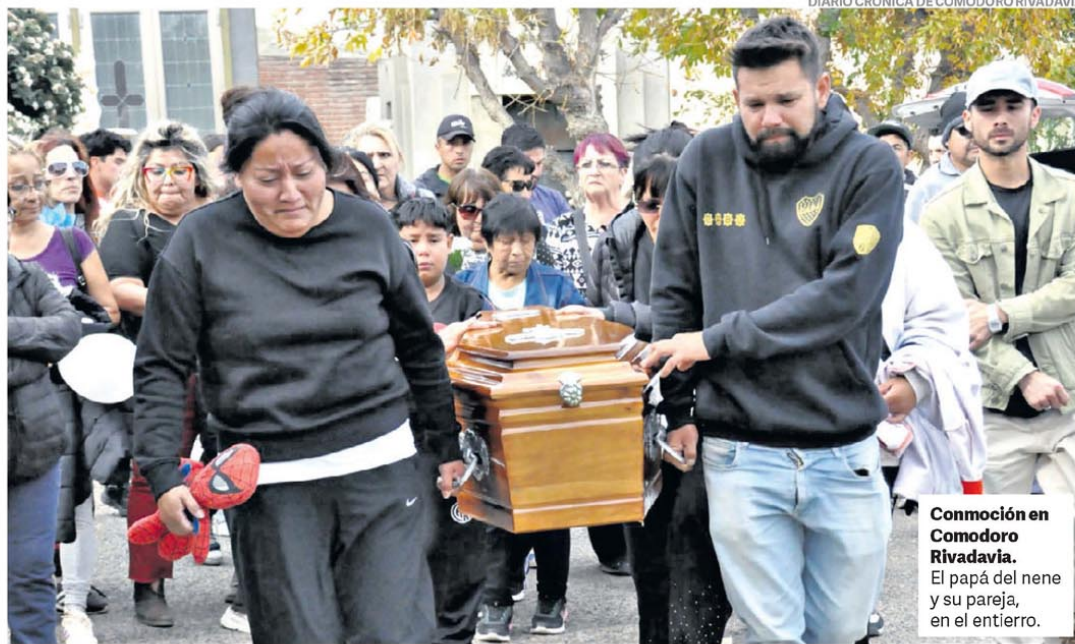
DIARIO CRÓNICA DE COMODORO RIVADAVIA

Aportó más información sobre las operaciones inmobiliarias del jefe de Gabinete.