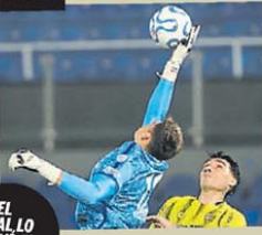
EN EL FINAL, LO SALVO EL ARQUERO.

SAN LORENZO NO ES GILL: 1-1 ANTE RECOLETA