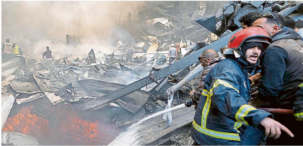
Una imagen dantesca en el centro de Beirut después de un ataque aéreo de Israel

MEDIO ORIENTE. Tras un devastador ataque de Israel al Líbano, Teherán se negaba a reabrir el estrecho de Ormuz; ratificaron, sin embargo, un diálogo directo el sábado en Pakistán