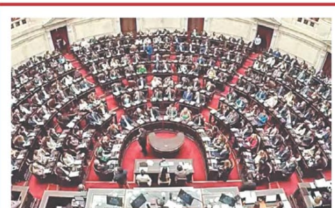
El debate se extendió en la Cámara de Diputados

El riesgo país le dio buenas noticias a Economía: cayó hasta 570 puntos básicos