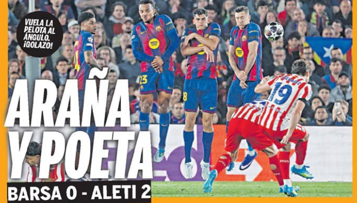
VUELA LA PELOTA AL ÁNGULO. ¡GOLAZO!