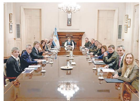
Mesaza de Gabinete, encabezada por el jefe de Estado