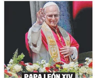
PAPA LEÓN XIV