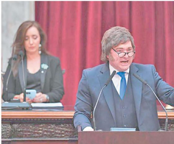
El jefe de Estado volvió a ser lapidario con la vicepresidenta

Con respaldo presidencial, el jefe de Gabinete encabezará hoy una reunión de ministros. Continúa la investigación sobre su patrimonio