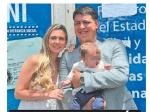
TEMPORAL EN TUCUMÁN