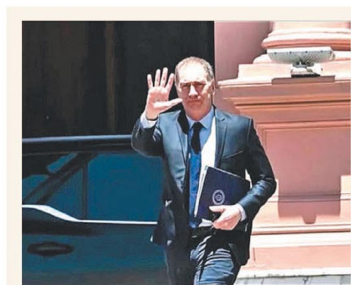
Diego Santilli retoma su gira por las provincias

IPC: se conoce el último dato de 2025 y cambia el método de medición PÁG. 3