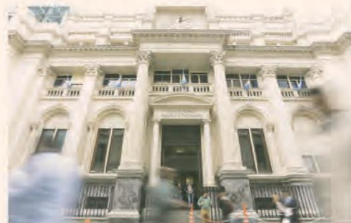
EL MERCADO ESPERA EL DATO DE INFLACIÓN