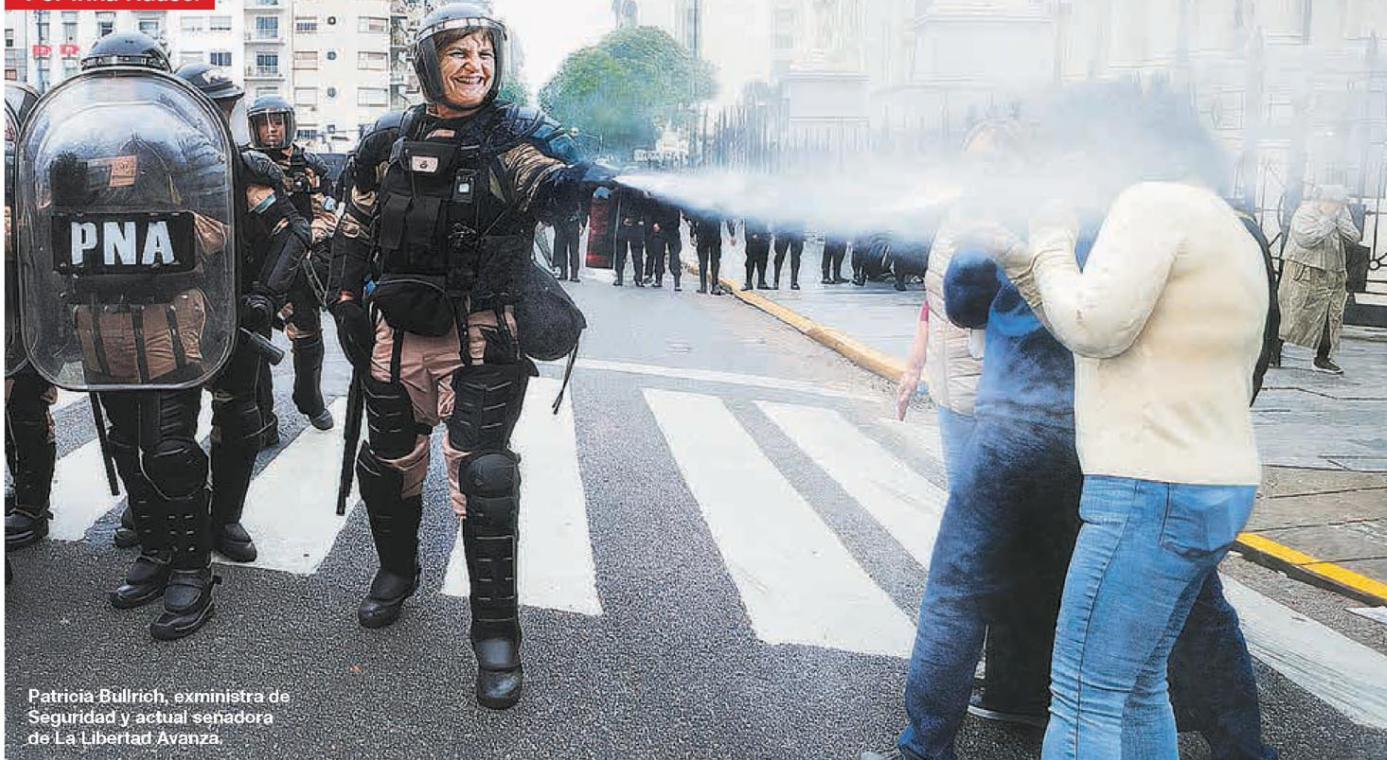
Patricia Bullrich, exministra de Seguridad y actual senadora de La Libertad Avanza.