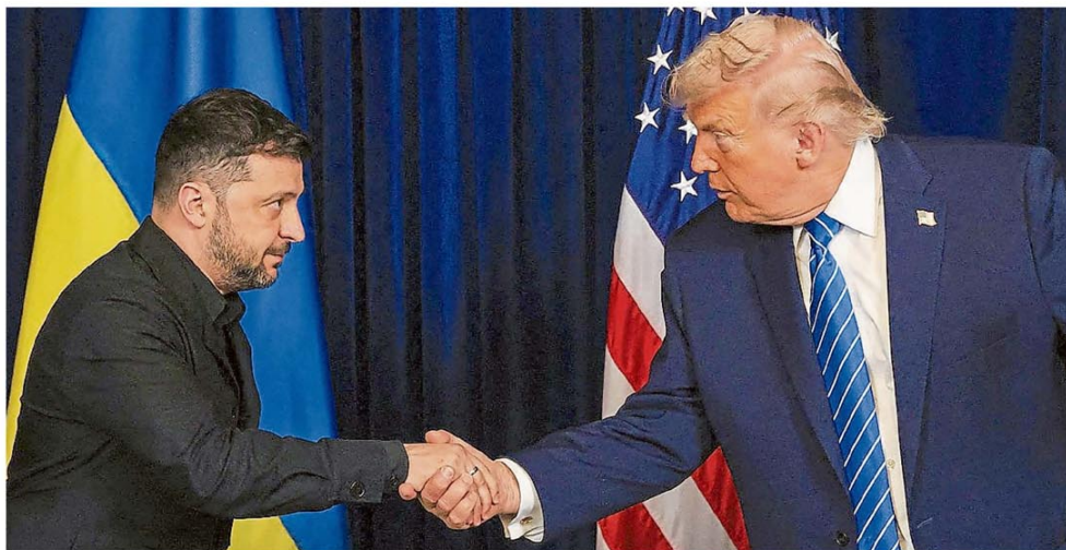
Volodymyr Zelensky y Donald Trump se saludan, ayer, en Mar-a-Lago, donde mantuvieron una cumbre de tres horas