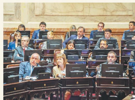
El Senado fue la última Cámara que sesionó en diciembre

Economistas plantean interrogantes sobre la oferta de divisas PÁG. 2