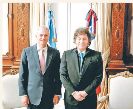
El presidente electo de Chile, en la Casa Rosada

El mercado celebró los anuncios y el riesgo país bajó a 561 puntos