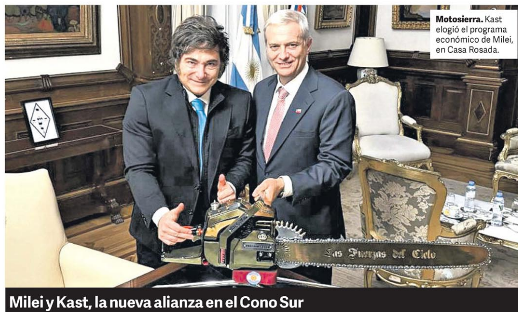
Motosierra. Kast elogió el programa económico de Milei, en Casa Rosada.