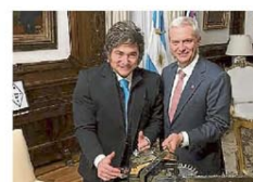
Milei y Kast en la Rosada

de financiamiento universitario. Se trata de leyes cuyo cumplimiento la oposición —incluidos aliados del Gobierno— venía reclamando. Para reforzar el acompañamiento de Pro, el Gobierno también incorporó el compromiso de pagar la deuda de coparticipación con la ciudad de Buenos Aires. Página 8