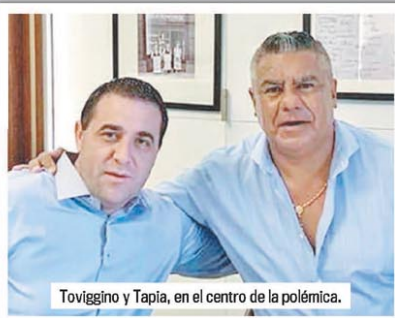
Tovigginio y Tapia, en el centro de la polémica.