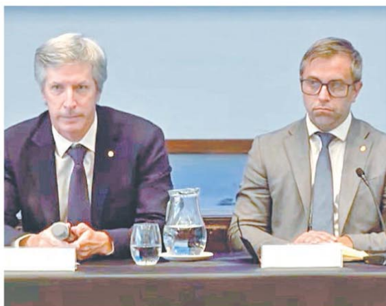
El titular del Banco Central, Santiago Bausili, y el director Federico Furiase brindaron los detalles de las nuevas medidas

El Banco Central anunció un paquete de medidas que incluye flexibilización de encajes y remonetización sin salto inflacionario