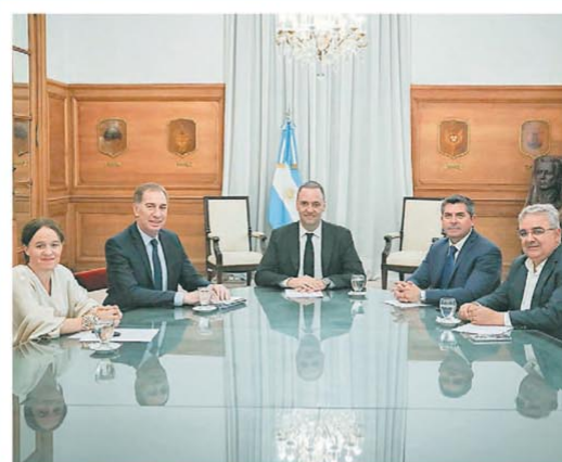
Adorni, con gobernadores, para pulir acuerdos

El Tesoro enfrenta una exigente renovación de 14 billones, aunque esta vez en pesos PÁG. 3