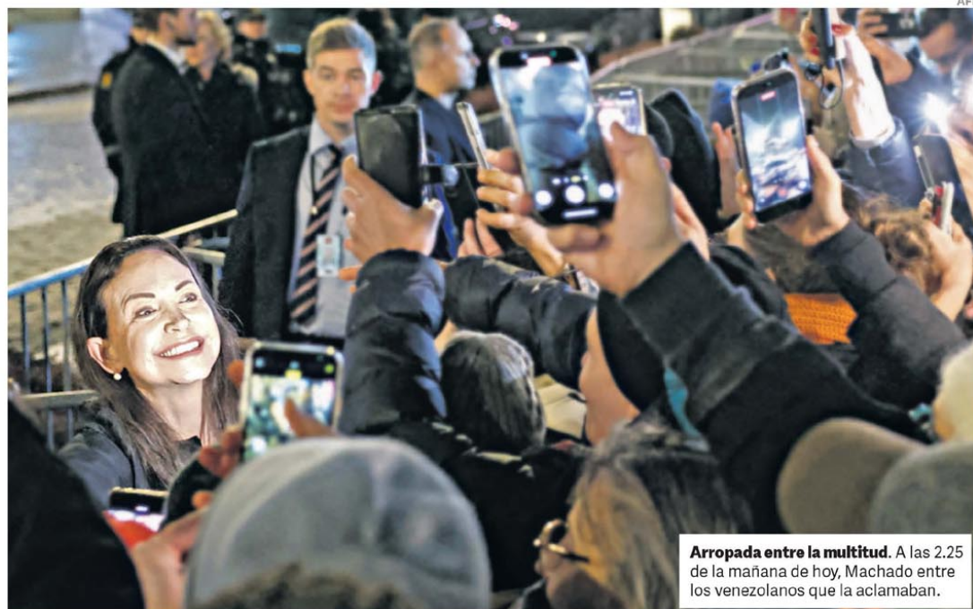
Arropada entre la multitud. A las 2.25 de la mañana de hoy, Machado entre los venezolanos que la aclamaban.

Vuelos, micros y hoteles colapsados para la final Estudiantes-Racing, que coincide con un torneo de hockey. P.42