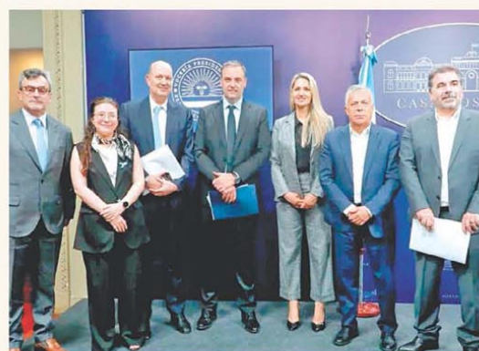
El Consejo de Mayo cerró acuerdos generales

Economía sale a colocar deuda por USD1.000 millones a una tasa por debajo del 9% PÁG. 2