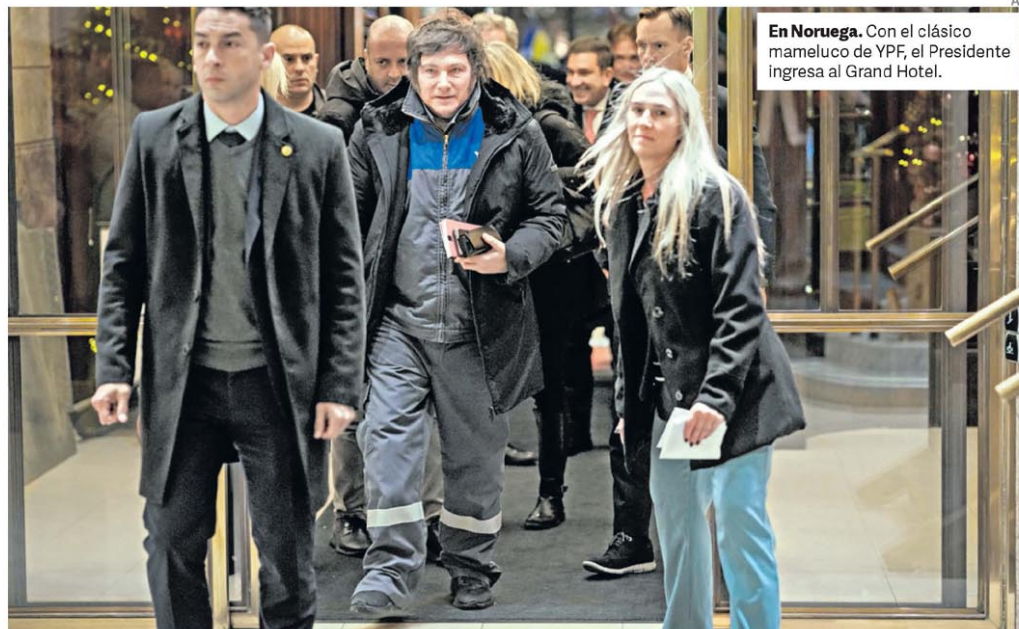
En Noruega. Con el clásico mameluco de YPF, el Presidente ingresa al Grand Hotel.

La edición 2025 de las pruebas que se hacen cada dos años a chicos de séptimo grado mostró una mejora. La proporción de los que alcanzan sus objetivos creció 3,8 puntos porcentuales en Lengua y 7,2 en Matemática, aunque en este caso el nivel sigue bajo: sólo 4 de cada 10 rinden bien. P.34