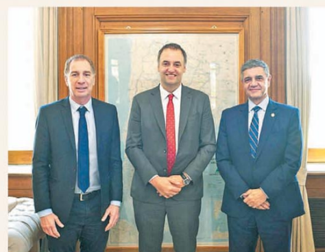
Santilli, Adorni y Jorge Macri, jefe de Gobierno porteño

Los industriales tuvieron un año de fuerte caída pero son optimistas para 2026 PÁG. 3