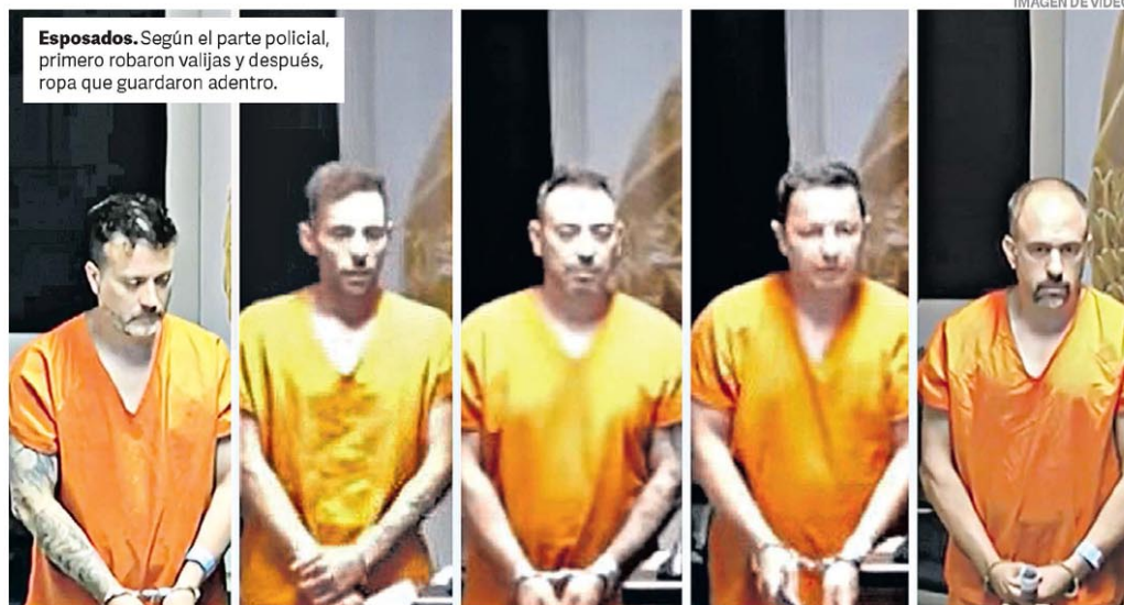
Esposados. Según el parte policial, primero robaron valijas y después, ropa que guardaron adentro.