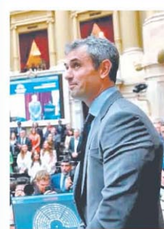
Menem será reelecto

Hoy juran los nuevos diputados y LLA será el bloque mayoritario