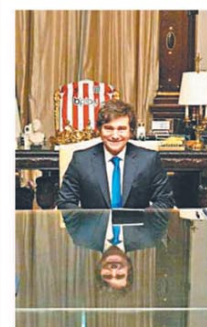
La señal del Presidente

Milei sube al ring a Tapia y escala la disputa con la AFA