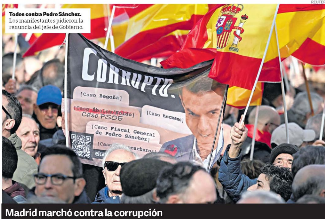
Todos contra Pedro Sánchez. Los manifestantes pidieron la renuncia del jefe de Gobierno.

Por la mayor demanda de viajes al exterior con el tipo de cambio estable, 2025 cerrará con una histórica salida de dólares. En lo que va del año ya se fueron US$ 9.000 millones, y las proyecciones están en el orden de los US$ 13.000 millones este año, equivalentes al 1,6% del PBI. En el 2024, este indicador había alcanzado los US$ 5.500 millones. Entre los destinos más elegidos figuran Brasil, Chile, Punta Cana, Aruba, Miami y Madrid. P.6