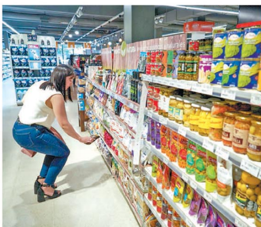
En la última semana se redujo un poco la presión inflacionaria

El balance cambiario de octubre volvió a mostrar desequilibrio. Sin los dólares del agro, el rojo fue de USD2.599 millones