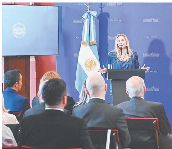
Les regaló copias de la Constitución a los futuros legisladores

Logró conformar un bloque con legisladores del PRO, de la UCR y de fuerzas provinciales y amplía el consenso antes del recambio