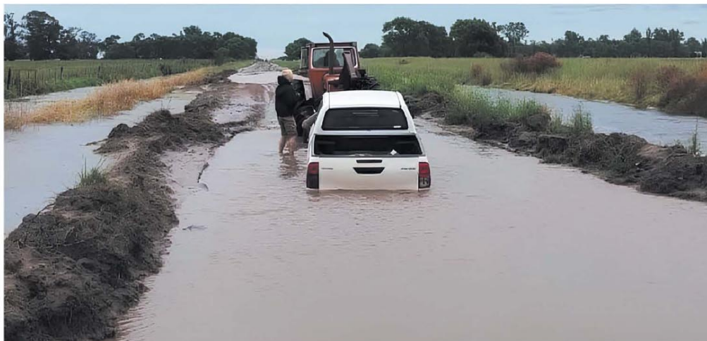
Este camino rural en Cadret, Carlos Casares, es solo una muestra de la situación de los campos en esa región de la provincia

El apodo "el Jefe", que Javier Milei le puso a su hermana Karina, no es una broma ni una simple metáfora para casi todos los funcionarios del Gobierno. Karina Milei es la jefa de la administración (¿por qué su hermano elude el sustantivo femenino que le corresponde?), sobre todo después de los fulminantes cambios del fin de semana. El Presidente eligió esa fórmula porque él prefiere dedicarse a la economía (territorio donde Karina Milei no influye ni lo intenta) y a pregonar las ideas libertarias por el mundo. Continúa en la página 13