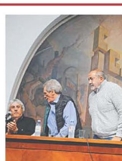
Reemplazo del triunvirato

Karina Milei recibió a los diputados electos y les pidió "compromiso" con las reformas