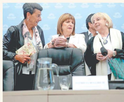
Bullrich fue a Diputados y la Rosada convoca a gobernadores

Luis Caputo: "En esta elección quedó en evidencia el riesgo kuka" PÁG. 3