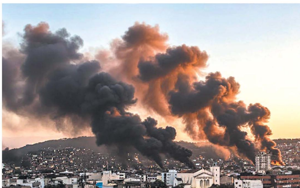
Ni Gaza ni Beirut: columnas de humo en Río de Janeiro, Brasil, tras el enfrentamiento entre la policía y Comando Vermelho

MIÉRCOLES 29 DE OCTUBRE DE 2025 | LANACION.COM.AR