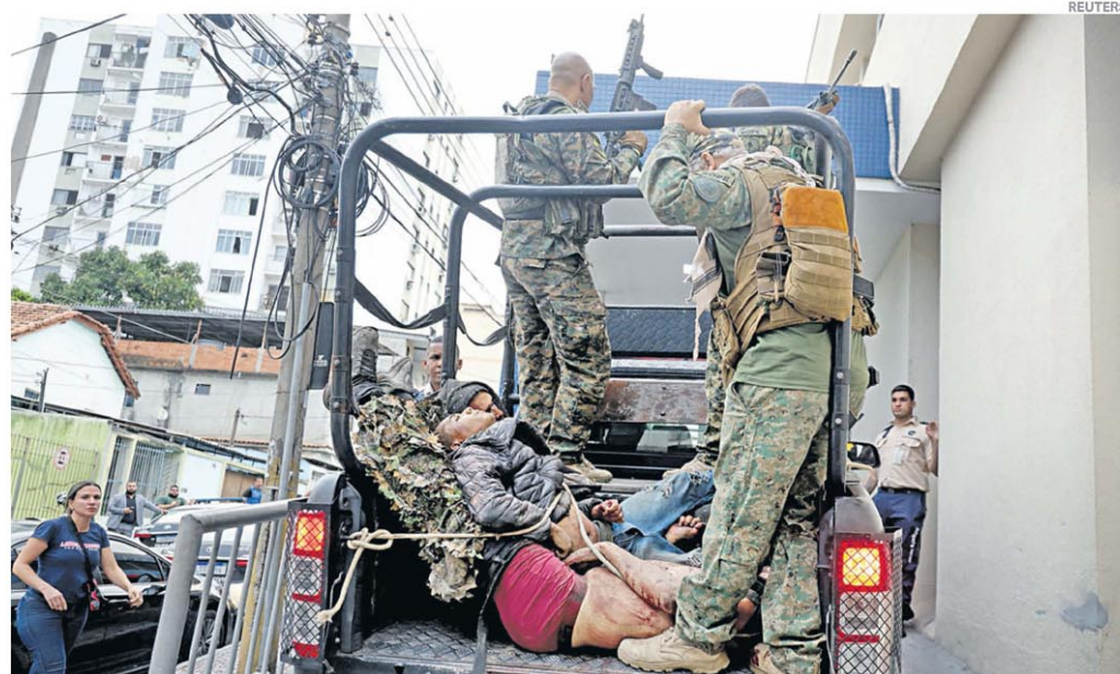
Cadáveres apilados. La Policía decomisó gran cantidad de droga y fue recibida con bombas. "Es narcoterrorismo", dijo el gobernador.