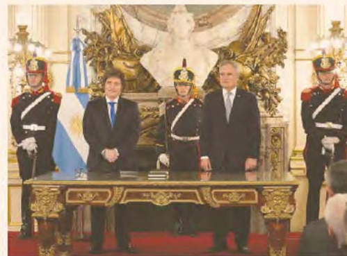
PABLO QUIRNO ASUMIÓ EN LA CANCELLERÍA