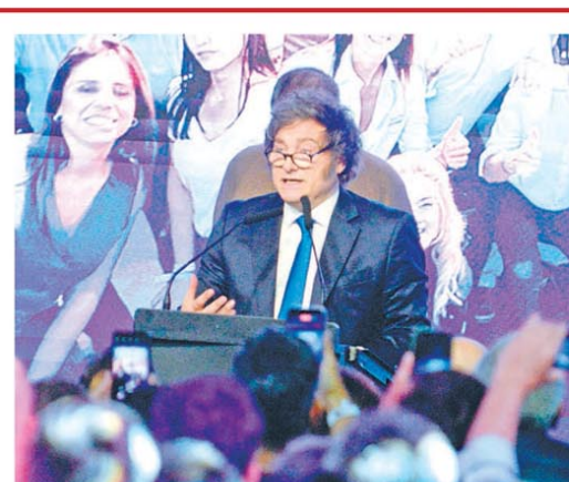
El Presidente estrenó un tono moderado el día de la elección

Más apoyo: Bessent aseguró que llegarán inversiones PÁG. 2