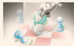
ILUSTRACIÓN FRANCISCO MAROTTA

Hernán de Goñi Director Periodístico — p. 2 —