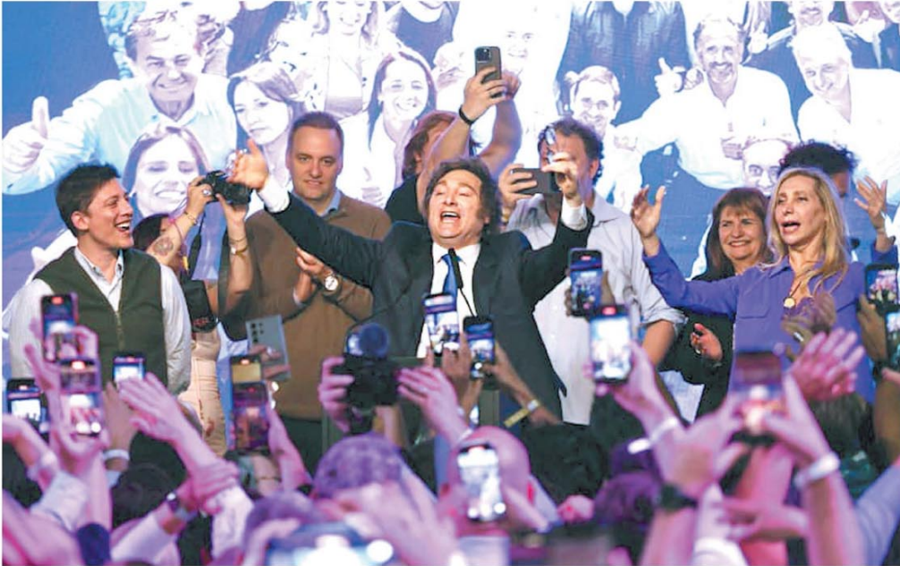
El presidente Javier Milei, su hermana, Karina, y el asesor Santiago Caputo en el festejo electoral de anoche

El oficialismo tendrá ahora un mayor margen de maniobra en el Congreso. En Diputados sería, con sus aliados, la fuerza más numerosa. No solo blindó el tercio de bloqueo, sino que quedó cerca del quorum propio. Con ese capital, el presidente Javier Milei hizo anoche un llamado a construir acuerdos parlamentarios. Páginas 2a-35