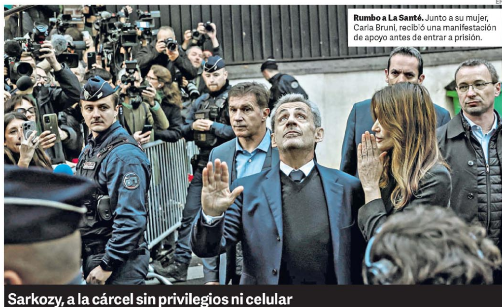
Rumbo a La Santé. Junto a su mujer, Carla Bruni, recibió una manifestación de apoyo antes de entrar a prisión.