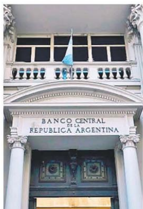
El BCRA volcó USD45 M

El paquete de medidas en tándem entre Estados Unidos y Argentina muestra poca efectividad