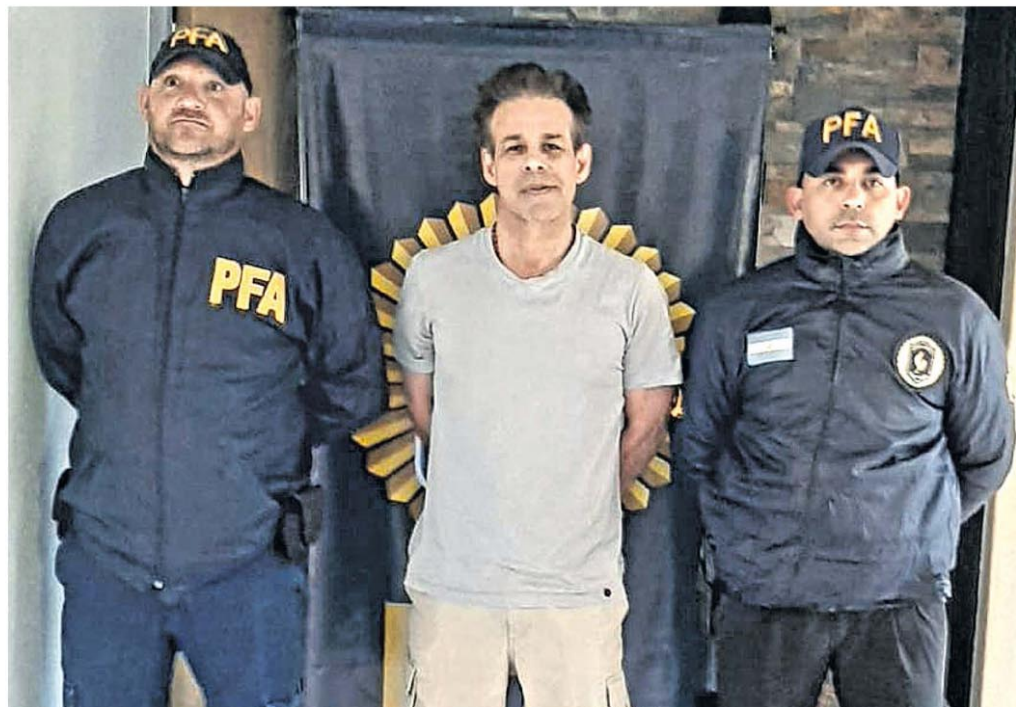
Detenido. Dejó la prisión domiciliaria, y fue llevado a la delegación de la Policía Federal en Neuquén, a la espera de ser extraditado.