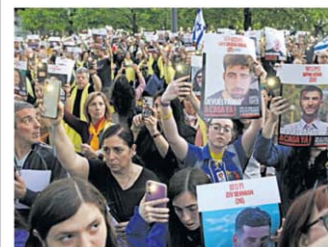
Recuerdo. Ayer, en Parque Centenario.

La cifra oficial fue del 2,2% en septiembre. Así, revirtió la desaceleración de agosto, que había sido de 1,6%. Las frutas (6,5%) y verduras y legumbres (4,9%) lideraron los aumentos de alimentos. En tanto, la suba del transporte fue de 3,5%, motivada por el incremento en el precio de los combustibles. P.18