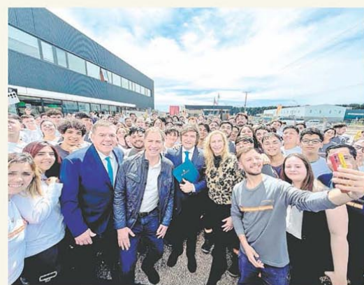
Milei fue a Mar del Plata con sus dos candidatos

El IPC CABA aceleró tras la devaluación y marcó 2,2%