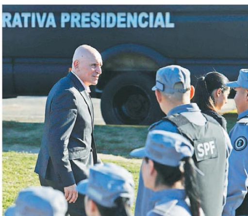
El último acto, en el servicio penitenciario, del ahora ex candidato

El Presidente tuvo que aceptarla tras las contradicciones sobre el vínculo con un empresario acusado de realizar negocios ilícitos