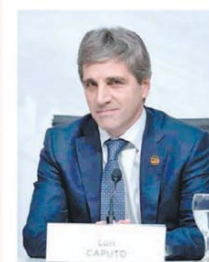
El ministro está en EE.UU.