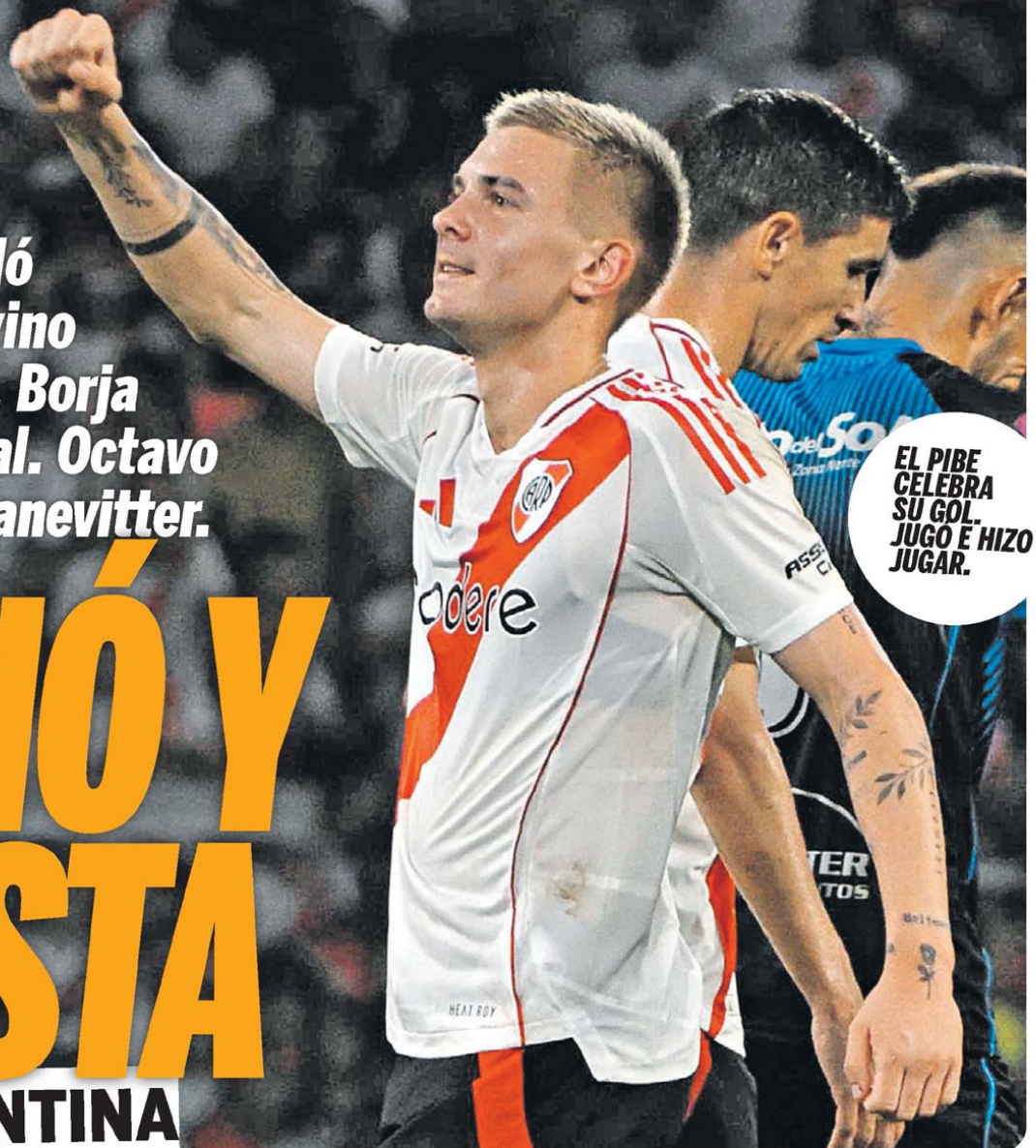
EL PIBE CELEBRA SU GOL. JUGO E HIZO JUGAR.