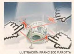
ILUSTRACIÓN FRANCISCO MAROTTA

Hernán de Goñi Director Periodístico — p. 2 —