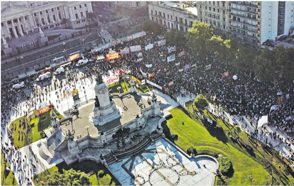
Congreso. La zona fue totalmente vallada y hubo un muy fuerte operativo de seguridad. La manifestación fue en calma.