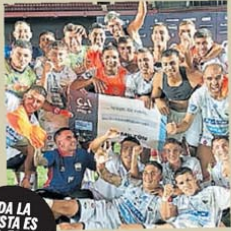
TODA LA FIESTA ES DEL EQUIPO DE T. B.

diariooleok diario.ole @diarioole @DiarioOle www.ole.com.ar