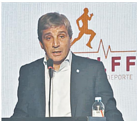
El ministro de Economía marcó el rumbo de la negociación

El Gobierno confía en que el Senado apruebe el pliego de Lijo para la Corte