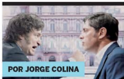
POR JORGE COLINA

de Presidencia de la Nación. “Este acuerdo permitirá fortalecer el balance del Banco Central, hito esencial para consolidar la estabilidad monetaria, financiera y macroeconómica y continuar con el proceso de desinflación y de liberación de las restricciones cambiarias”, agregaron ►P2