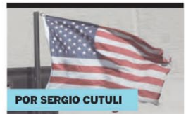
POR SERGIO CUTULI