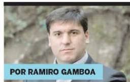
POR RAMIRO GAMBOA

PESOS Si Nación no va a ayudar más a PBA, corresponde que le devuelva sus potestades tributarias ►P3