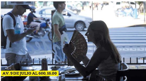
AV. 9 DE JULIO AL 600, 16.00