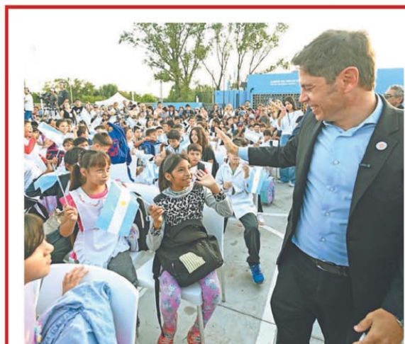
El gobernador inauguró el ciclo lectivo en Pilar

El riesgo país cayó con fuerza y se alejó de la zona de los 800 puntos básicos ante el optimismo sobre las negociaciones con el Fondo Monetario