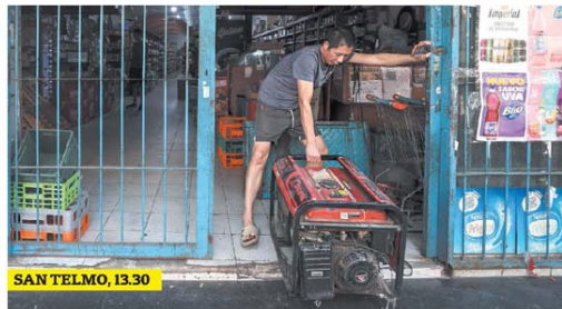
SAN TELMO, 13.30

Postales de una ciudad sumida en el caos ayer, ante la falta de energía