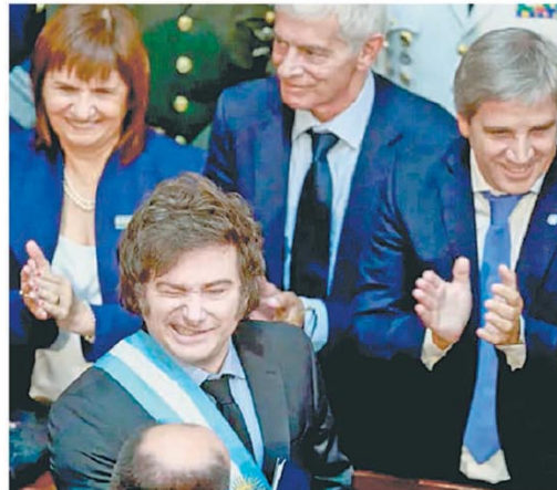
El Presidente anticipó avances ante del Congreso

El sector agroexportador liquidó USD2.18 millones en febrero, lo que representó un incremento del 45% frente a lo registrado durante el mismo mes de 2024