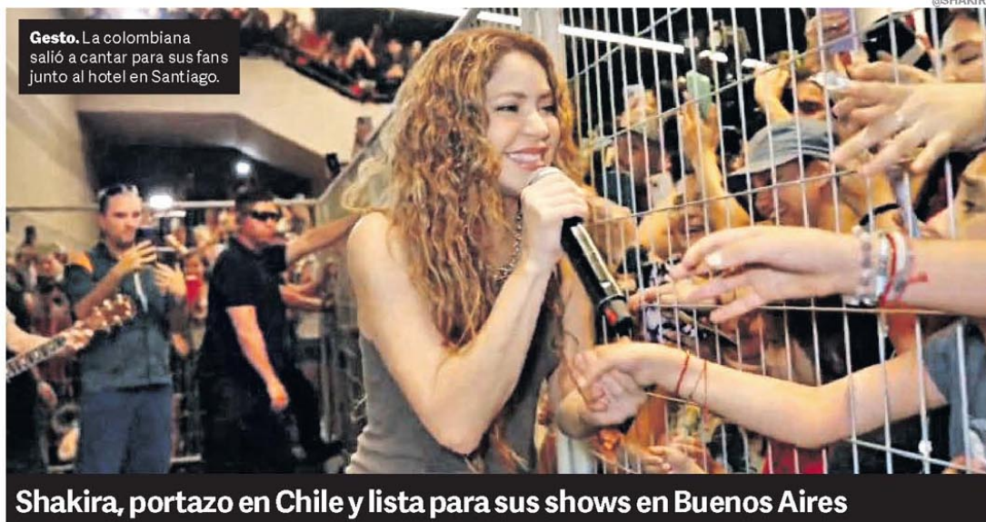
Gesto. La colombiana salió a cantar para sus fans junto al hotel en Santiago.

El campo argentino Cítricos, vinos, carnes y miel, los más afectados.