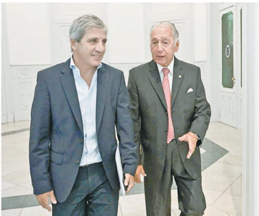
En medio de las tensiones, el ministro con Funes de Ríoja

El Merval anotó una pérdida de 5,1% medido en dólares y acumula una baja del 10%. Los bonos en dólares siguieron en contracción